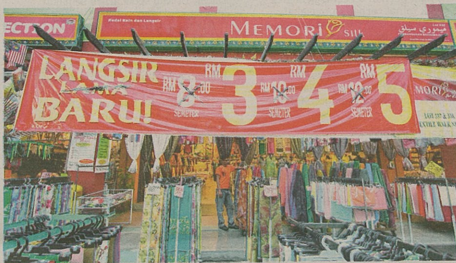
TARIKAN harga dan pilihan bagi barangan seperti kain serta langsir telah membuatkan ramai pelanggan sanggup datang dari jauh ke lokasi ini setiap kali musim perayaan.

"Di sini tiada gangguan atau masalah kena rompak mahupun ragut. Tiada masalah pengangkutan kerana bas awam