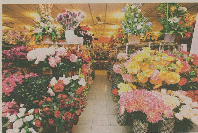
BANYAK kedai menjual barangan perhiasan seperti bunga-bunga hiasan dan barangan keperluan perkahwinan.