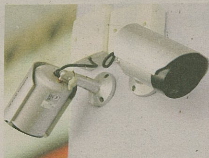
KAMERA kawalan keselamatan turut dipasang sebagai langkah pengawasan kawasan perniagaan.