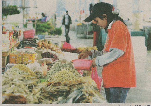
PELBAGAI keperluan dapur boleh dibeli di pasar basah Nilai 3 yang beroperasi 24 jam.

◀ satu pusat sehenti beli-belah untuk semua orang.