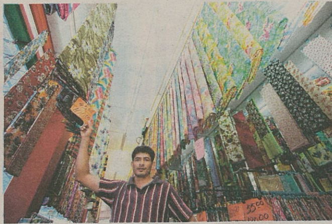
VARIASI pilihan tekstil seperti kain sutera, satin dan kapas sering menambat perhatian wanita.