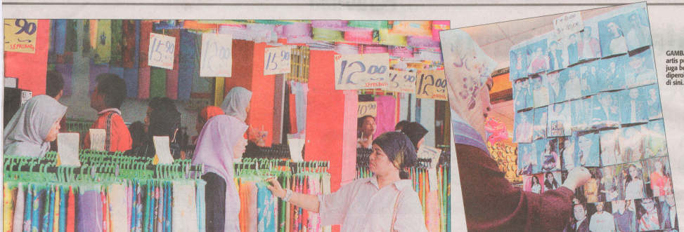
GAMBAR artis pajan juga boleh diperolehi di sini.