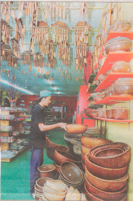
BARANGAN perhiasan ala Bali kerap menjadi tumpuan ramai.