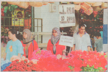
PNUTY masuk Nilai 3, Hegeri Sembilan bagekan pasar borong barang murah.

Benay mengahala ke selatan dalam perjalanan 40 minit hingga satu jam dari