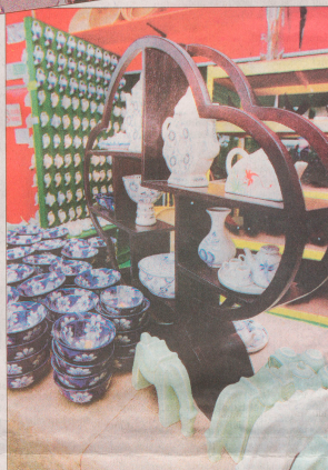
SERAMIK menjadi pilihan pengunjung.

Secara tidak langsung, perniagaan makanan dan minuman turut menerima kesan daripada jualan murah dan ketenterahan di Nilai 3. Di samping itu ia bukan sekadar memberi peluang kepada orang ramai membeli barangan dengan kadar lebih murah, malah memberi kesan besar kepada perkembangan industri lain.